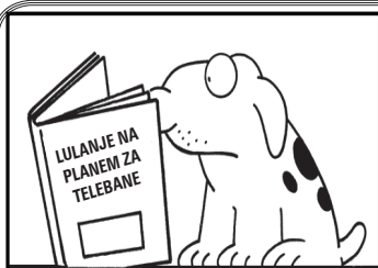
Sestavila: Ana Dragičević

Distributer hrane Arden Grange v Sloveniji je podjetje Avanturist d.o.o., tel.: 02/2516202.